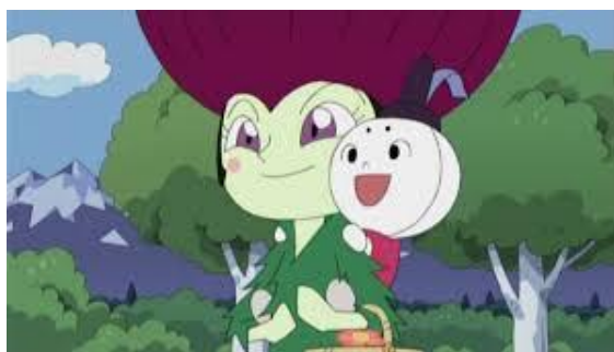
それいけ！アンパンマン マシュマロさんとあざみちゃん