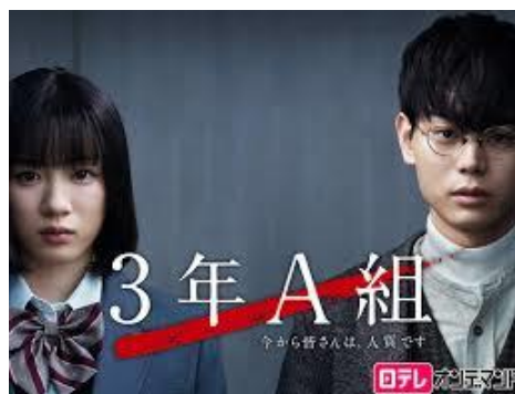
3年A組 今から皆さんは、人質です