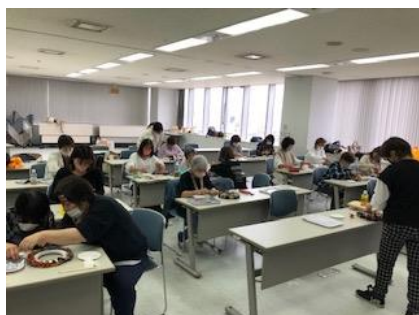
クリスマスリース作り