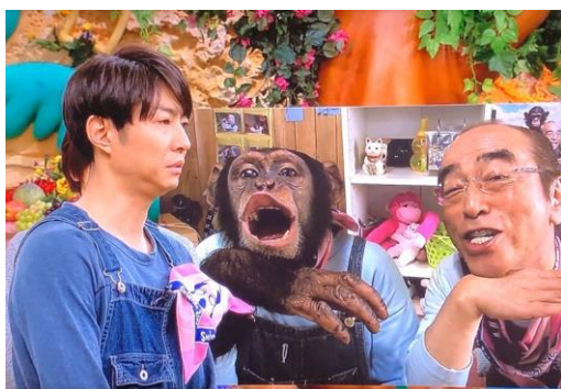
天才！志村どうぶつ園 16年半ありがとう 園長と一緒に… 最終回スペシャル