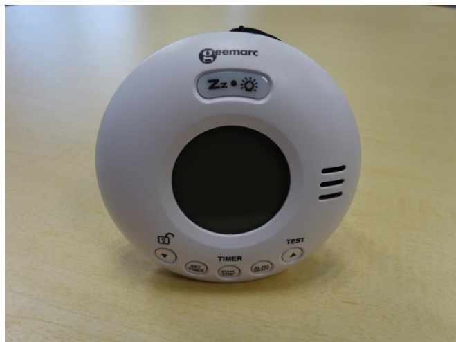
ウェイクン シェイク・ボイジャーV2