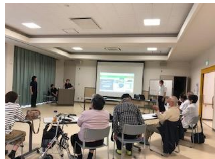
教えて! キャッシュレス決済