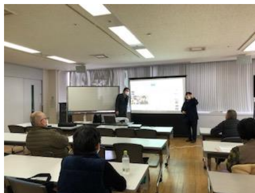
みみ企画「教えて！パイパイ・電子マネー」