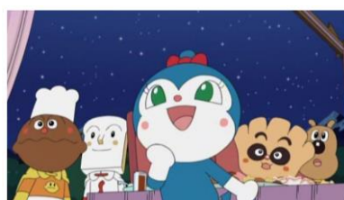
それいけ！アンパンマン コキンちゃんとパン工場