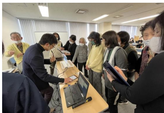
IT講習会「レルクリア体験・字幕電話サービス体験」

透明ディスプレイを使って文字起こししてくれる「レルクリア」、スマートフォンやタブレットに相手の声を文字で聞く「字幕電話サービス」を実際に体験することができました！