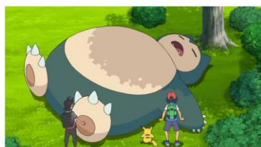
ポケットモンスター カビゴン巨大化！？ ダイマックスの謎！！