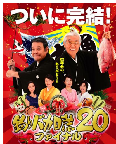
釣りバカ日誌20 ファイナル