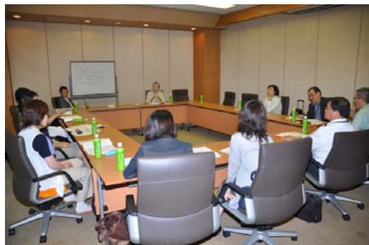
ブロック会議の様子

本年、新しく2つの施設が設置され、また近く設置見込みの地域もあるということで、去る3月に甚大な被害を起こした東日本大震災で、聴覚障害者のおかれている状況を見ましても、このように全国聴覚障害者情報提供施設協議会が大きくなっていくことは誠に喜ばしい限りであります。