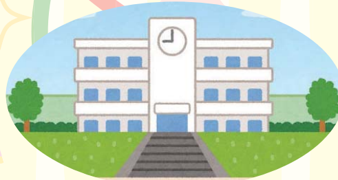
ろう学校 (相談センターゆかり)