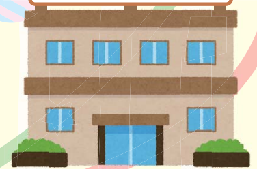
聴覚障害児支援中核拠点 (県聴覚障害者情報センター内)